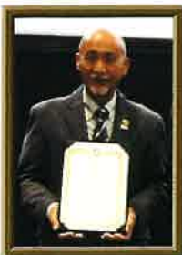
みんなのSDGs 授賞式にて

神奈川県企画の「みんなのSDGs」に応募し、登録パートナー約1300社・団体の応募67件の中から、当法人の取組み『 障害者が作るアップサイクル(Upcycle)自主製品「エコマグネット」の創出と販売推進 』が2023年度の栄えある「みんなのSDGs 賞」に選ばれました!!! 2月8日にパシフィコ横浜にて表彰式が開催され、賞状をいただきました。これも多くの皆様の応援のおかげであり、この紙面を借りて感謝申し上げます。