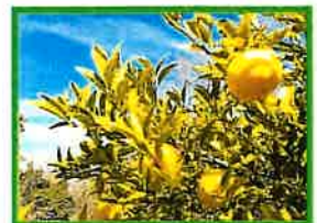
香かおる曾我山 (小田原市) 2024.2

上記の想いや私たちの活動は、「SDGs」にも①福祉の促進や差別の解消・不平等の是正、②自然環境の保護及び回復(持続可能な生態系や森林の保護・回復、気候変動の軽減等)への取組みによる『 誰一人取り残さない 』 持続可能で多様性と包摂性のある社会 を目指す思想など、深いつながりを持っていると捉えています。