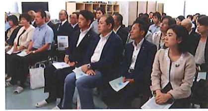
理事長挨拶に 聴き入る皆様