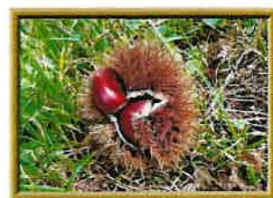
収穫の秋(小田原市近傍) 2024.9

上記の想いや私たちの活動は、「SDGs」にも①福祉の促進や差別の解消・不平等の是正、②自然環境の保護及び回復(持続可能な生態系や森林の保護・回復、気候変動の軽減等)への取組みによる『 誰一人取り残さない 』 持続可能で多様性と包摂性のある社会 を目指す思想など、深いつながりを持っていると捉えています。