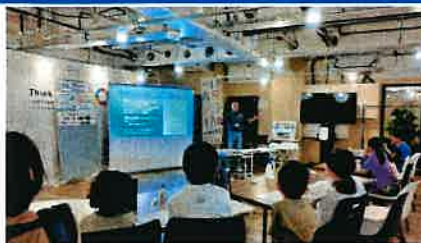
熱心に耳を傾ける子ども達

小田原市SDGs企画『夏休み子どもSDGsイベント』に参画し、エコマグネットを子ども達と一緒に作ることを通して、障害福祉への取組みやエコキャップ活動とコロナ禍からエコマグネットが生まれたストーリーを紹介するなどして、当法人では色々な視点からSDGs推進に取り組んでいることや児童の皆さんにもできるSDGsの取組みがあることなどをお話させていただきました。小田原市が当法人のイベント公開後、参加応募(最大20名+保護者)が半日で満席になるなど、盛大なイベントになりました。子供たちのSDGsに対する関心や意識が少しでも高まって行けば嬉しく思います。